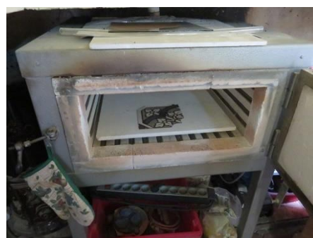
Travail de grisaille, peinture et cuisson